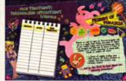
▲ Vedastin Brochure