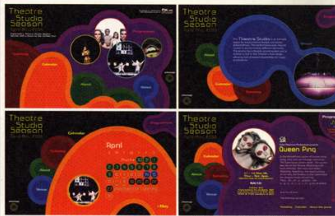
▲ Explorade "Theatre Studio Season" Website