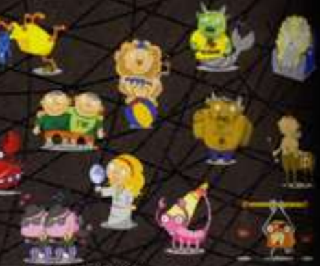
Illustration (Made For Business)

離開工作設計最在乎什麼，那就是 deadline (截稿日)！要在截稿之前滿滿的把案子做完那是殘酷的。同樣的，要能讓觀衆在看到我們設計作品的同時，還能連接到設計的產品上，那也是不容易。不過在設計最困難的地方，是幻何讓你的設計能與客戶的需求結合，而被完整地呈現出來。