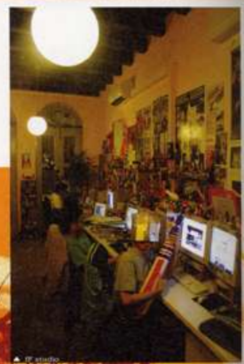
▲ IT studio