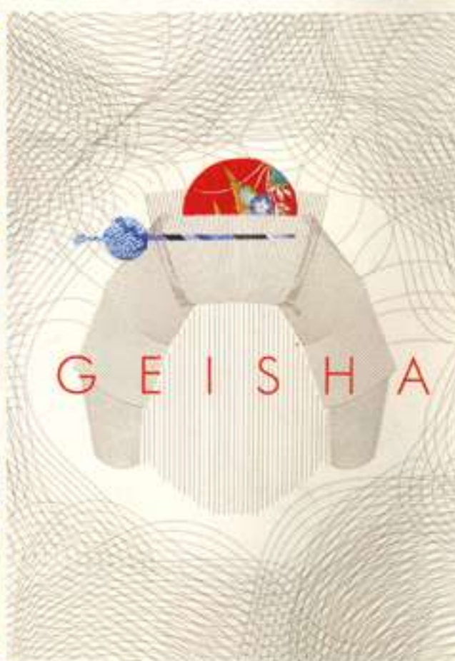
▲ Theatreworks "Geisha" Flyer